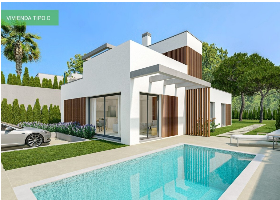
VIVIENDA TIPO C